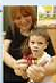
Мастер-класс для родителей. Изготовление открыток. Педагогическая поддержка творческой личности воспитанника