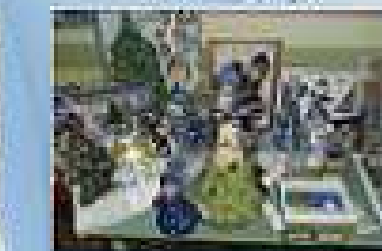
Тот, кто в жизни красиво сделал чужой дом, Сделает что-нибудь плохое для своего дома. Е. Мухоморова