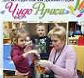
Мастер-класс для детей и родителей. Мастер-класс по изготовлению открыток