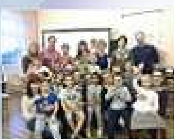
Педсоветы для родителей, консультации педагогов для родителей, индивидуальные консультации родителей

Процесс взаимодействия складывается постепенно, приходит время, когда диалог полноценный партнерский и совместно дети воспитаны и творчески развиты. Чтобы не быть субъективными и интуитивными, необходимо постоянно расширять круг взаимных контактов с педагогами и родителями ребенка.