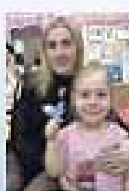
Консультация для родителей. Педагогическая поддержка творческой личности воспитанника