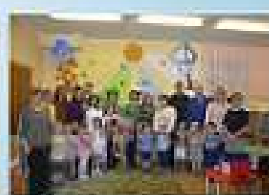
Детские праздники, конкурсы, выставки, мастер-классы, индивидуальные консультации родителей